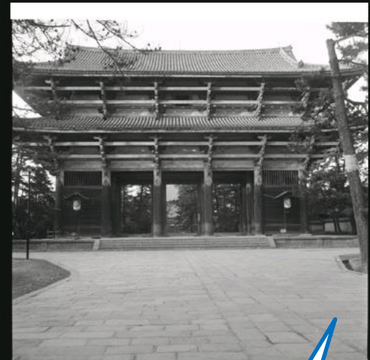
東大寺南大門全影、大影

ポイントをクリックすると、下部に写真一覧が示される。この写真一覧の画像をクリックすると、概要も見る事ができる。