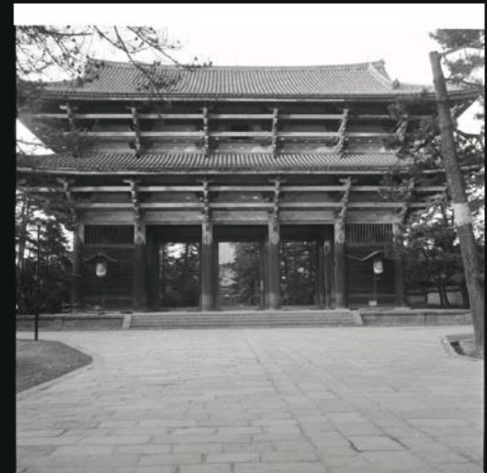
東大寺南大門全景、大影